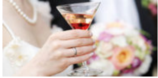
Getränkekarte für die Hochzeit

Sind Lebensversicherungen ein Auslaufmodell? (22.09.2015)