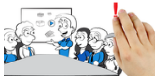
Mehr Erfolg dank Videomarketing